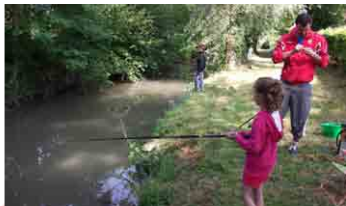
Fête de la pêche

Elle procède régulièrement à des empoisonnements de la Cheuille selon les besoins.