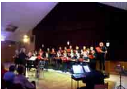
la chorale « Nuances » de l'Harmonie.