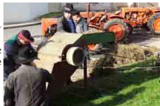
Foire St AIGNAN

L'an prochain, nous comptons renouer avec une voire deux soirées dansantes. La nouvelle équipe vous attend. Venez nous rejoindre, avec vos idées et votre bonne humeur !