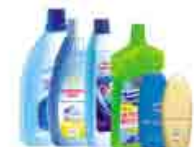
Flacons plastiques domestiques