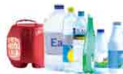
Bouteilles plastiques alimentaires