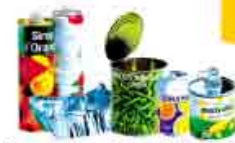
Boîtes en métal (Alu&Acier)