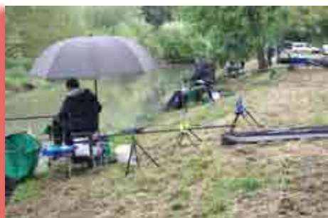
Concours de Pêche

Pour tous renseignements, contactez : Le Président : Jean CHABIN Tél : 02.38.31.54.80 ou 06.08.76.31.23