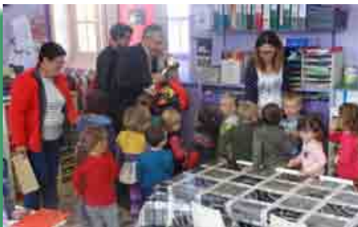
Remise prix concours vaches décorées Comice