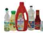
Flacons plastiques alimentaires gras