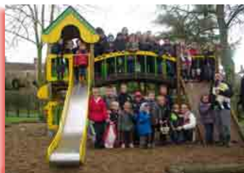
La chasse aux œufs

Le 14 juillet s'est déroulé avec son traditionnel concours de boules, ses jeux pour enfants, son défilé et son feu d'artifice, le Comité des Fêtes assumant l'animation musicale !