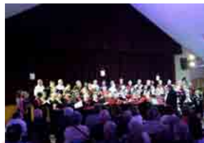
les 4 chorales réunies (Chatillon sur Loire, Annay, Léré et Bonny sur Loire)

29 mai et 6 juin : Concerts des écoles de musique d'Argent sur Sauldre et de Bonny sur Loire