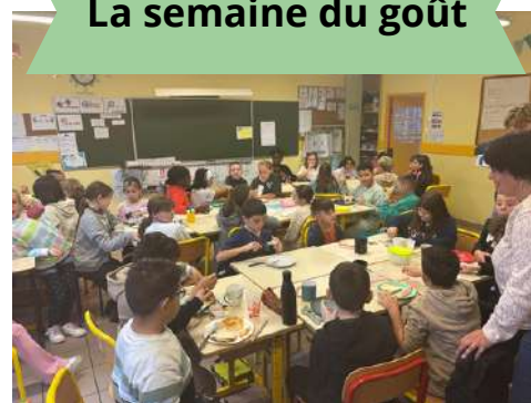
La semaine du goût

Un grand merci à toute l'équipe du restaurant scolaire pour son engagement quotidien et à nos partenaires locaux pour leur contribution à cette belle réussite.