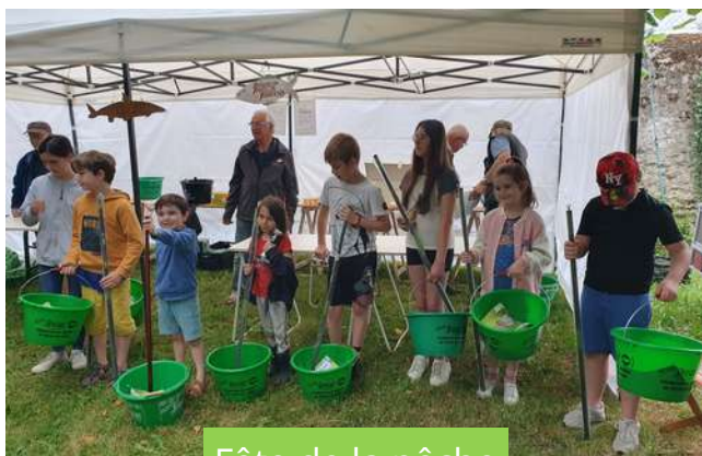
Fête de la pêche