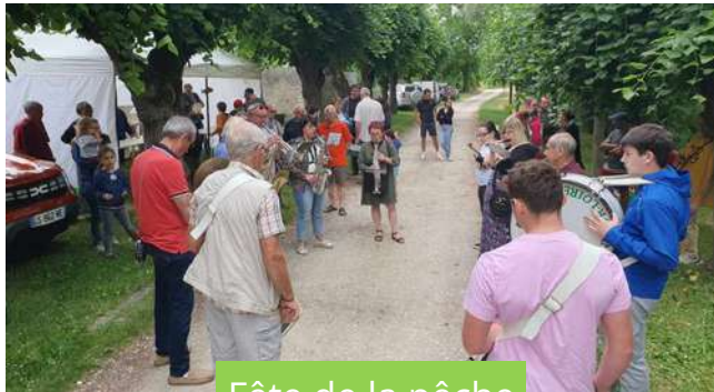
Fête de la pêche

Elle procède régulièrement à des empoissonnements de la Cheuille selon les besoins.