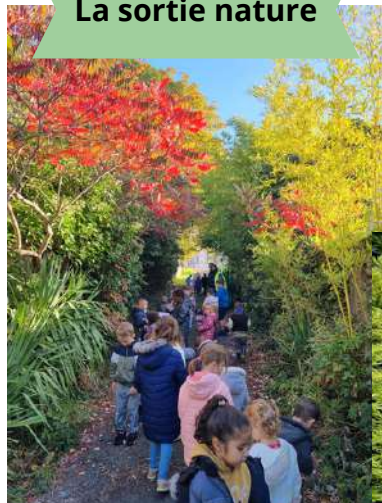
La sortie nature

Notre commune a la chance d'accueillir une école dynamique composée de 3 classes de maternelles et cinq classes de primaires.