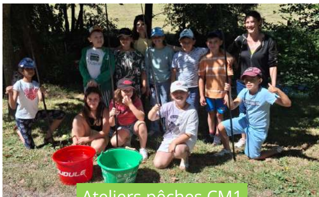
Ateliers pêches CM1